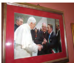
Beim Papstbesuch in Rom mit dem Bischof von Piedimonte Mons. Valentino di Cerbo.